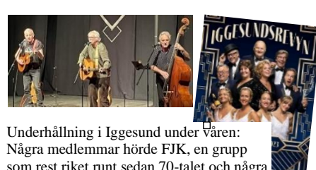
Underhållning i Iggesund under Våren: Några medlemmar hörde FJK, en grupp som rest riket runt sedan 70-talet och några avnjöt årets revy