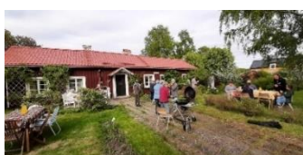
Vårens verksamheter avslutades på Iggesunds äldsta hus -Anundsgården, med Ljuspunkten